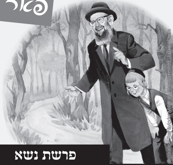
Illustration: Ben Aviner Miller and the Applesed, Judaea Press

איבערגעארבייט פאר קינדער פון די שמועסן פון הרב אביגדור מיללער זצ"ל דורך: פינחס בן-עמי